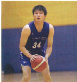
⑥男子バスケットボール部