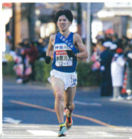
①陸上競技部駅伝チーム